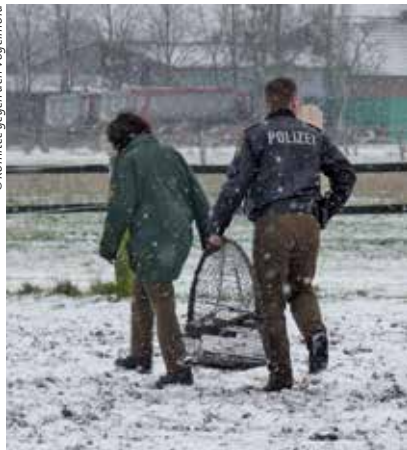
Polizisten stellen einen illegal aufgestellten Habichtfangkorb sicher.