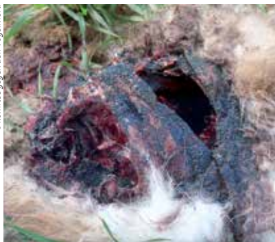
Bei diesem ausgelegtem Köder (Feldhase) ist das blau gefärbte Gift-Granulat gut zu erkennen.