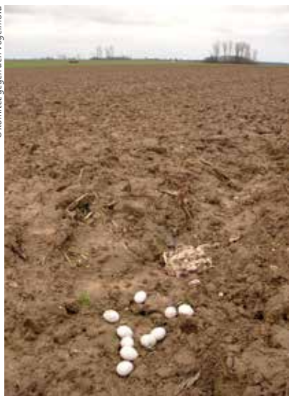
Mit einem Insektizid vergiftete Hühnereier und Schlachtabfälle, ausgelegt auf einem Acker.